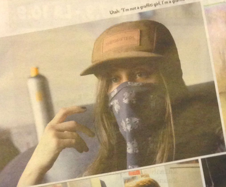
Utah: "I'm not a graffiti girl, I'm a graffiti writer."