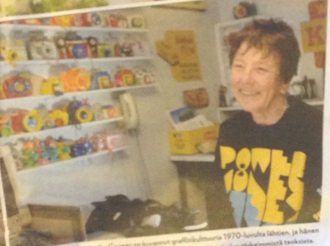
Martha Cooper on kuvannut graffitikulttuuria 1970-luvulta lähtien, ja hänen Subway Art -teostaan (1984) pidetään yhtenä alan tärkeimmistä teoksista.